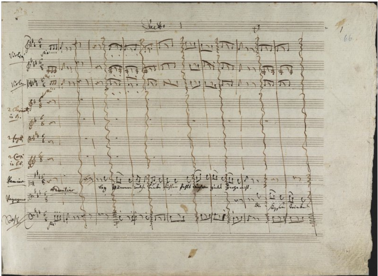
Wolfgang Amadeus Mozart, Die Zauberflöte (1791), Act I, no. 7, duet, "Bey Männern, welche Liebe fühlen" Autograph, Berlin, SBB, Mus. ms. autogr. Mozart, W. A. 620, 66r.